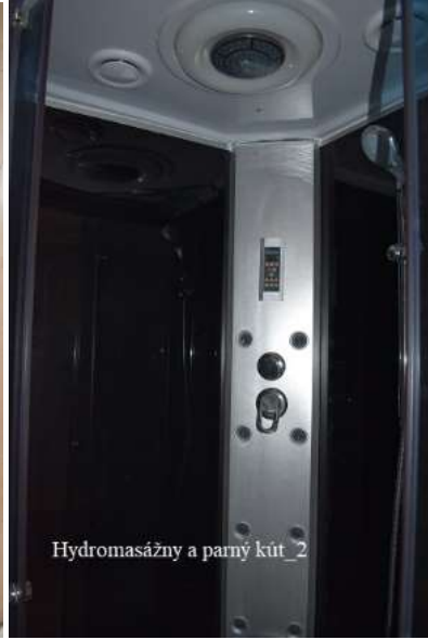
Hydromasážny a parný kút_2