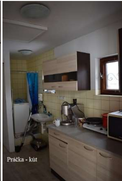
Práčka - kút