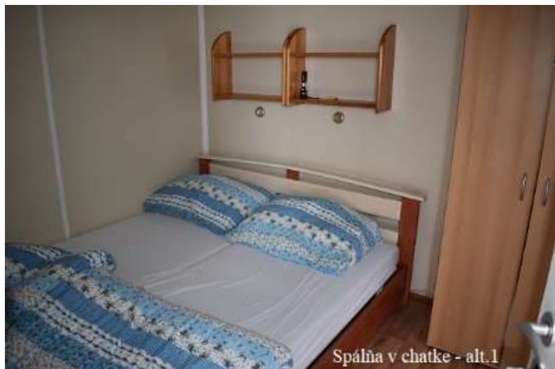
Spálňa v chatke - alt. 1