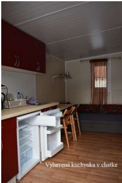
Vybavená kuchynka v chatke