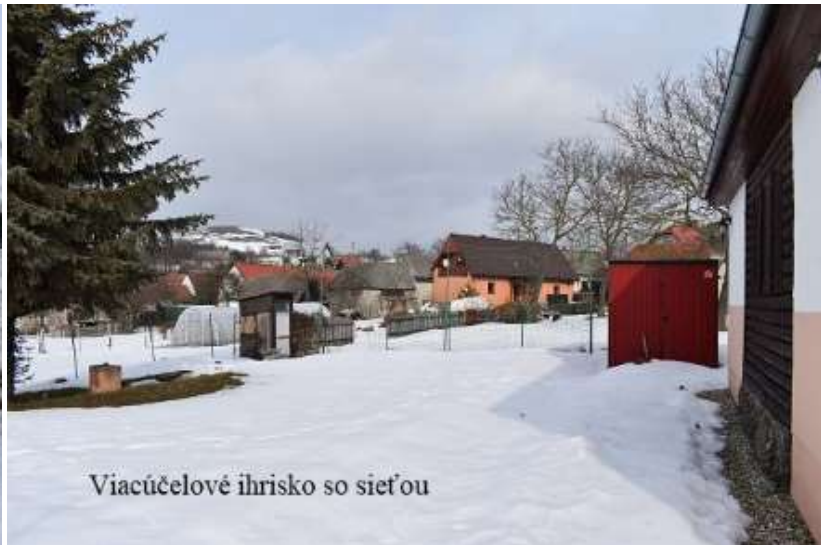
Viacúčelové ihrisko so sieťou