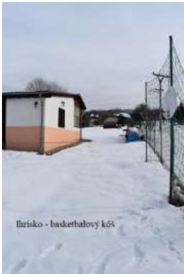
Ihrisko - basketbalový kôš