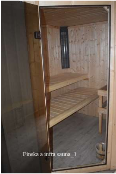
Fínska a infra sauna_1