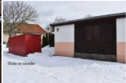
Boja na náradie