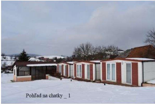
Pohľad na chatky _ 1