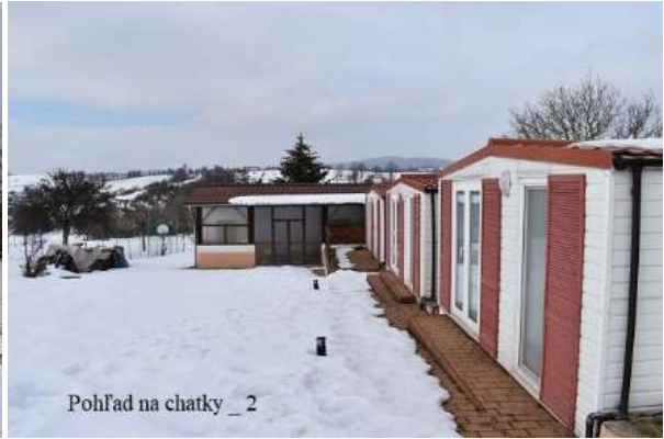
Pohľad na chatky _ 2