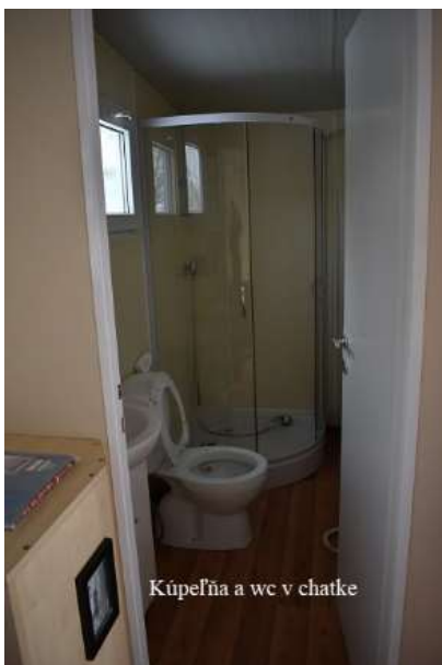
Kúpeľňa a wc v chatke