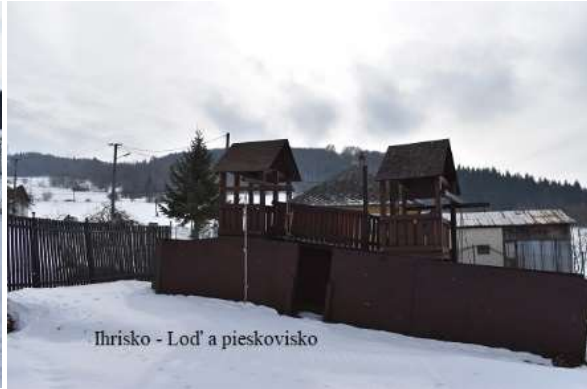
Ihrisko - Loď a pieskovisko